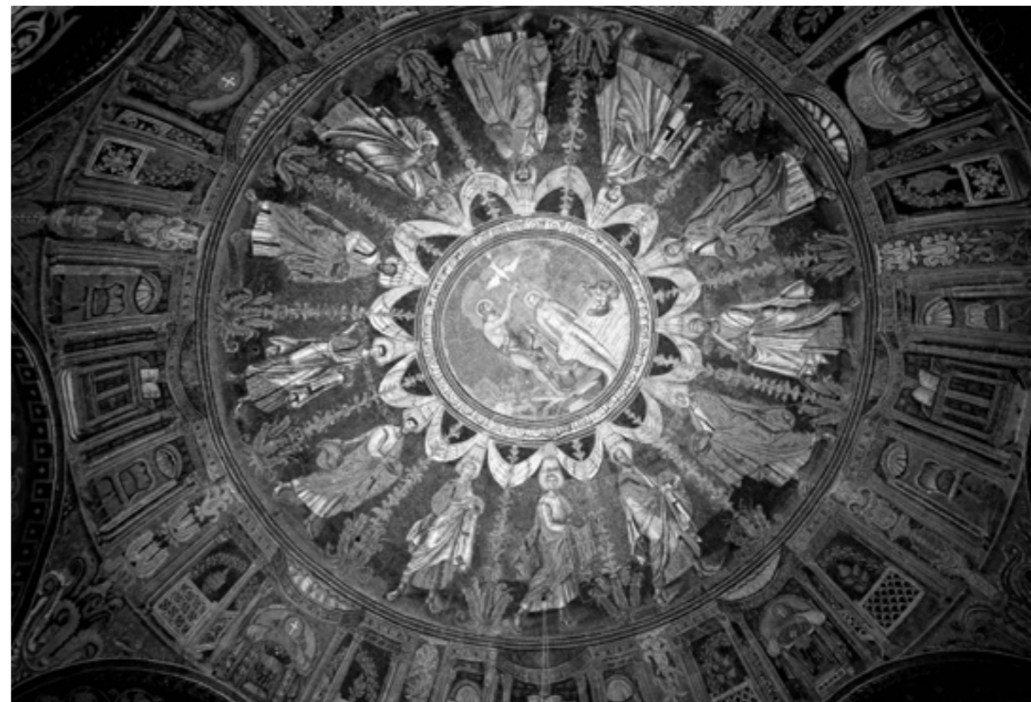
Baptisterium ortodoxních v Ravenně Autor: Ondřej Šindlář

Uvedené příklady jsou jen ukázkou z četných podobných příběhů v dějinách křesťanství. Jako pars pro toto ukazují, že svatá statečnost byla jednou z předních ctností celé řady křesťanských světců. Příběhy o jejich statečnosti měly povzbudit k podobnému chování. Některé sice mají podobu spíše zábavné literatury, jiné ale lze považovat za reálné události hodné obdivu a následování.