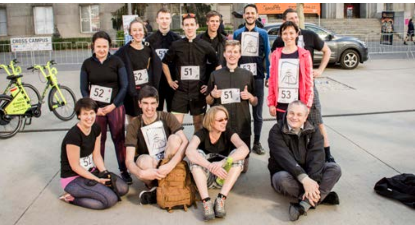
Štafetový běh Cross Campus, 16. 4. 2019, družstva Lotovy dcery, Bohoslovci 2, Nejsvětější čtveřice.