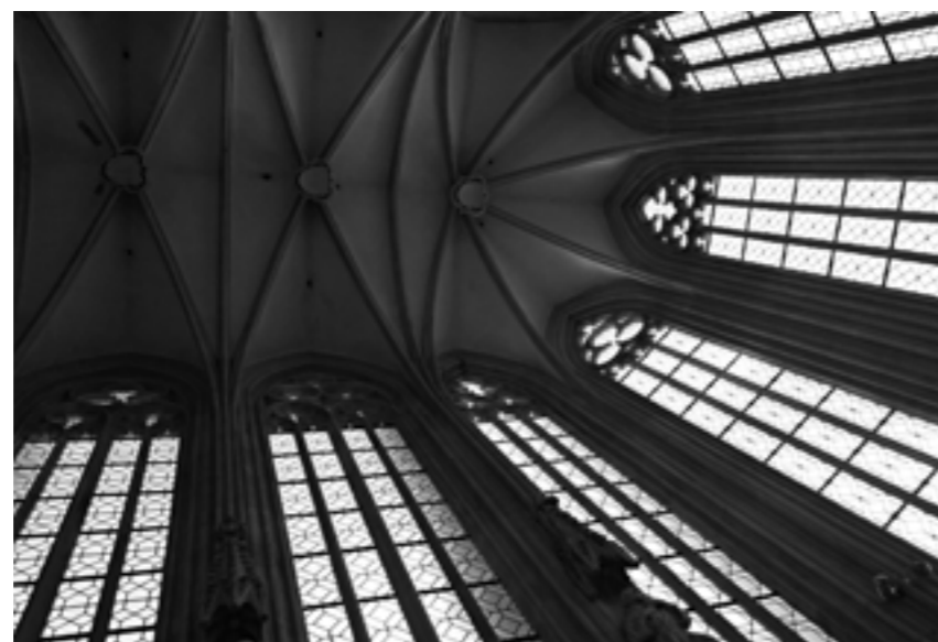
Kaple sv. Jana Evangelisty v Bratislavě

D.: Chtěl bys asi nějakou tabulku či vzoreček, nic takového ovšem neexistuje. Máš ale rozum a svědomí, které tě v každé možné situaci doprovázejí. Kromě toho máš také vzory jednání, které můžeš tím či oním způsobem následovat. Naše úvahy jsme začali u statečných vojáků, jejichž osudy nám připomínají jména dejvických ulic. Jako katolíci se však nemáme za co stydět. Vždyť kardinál Beran je člověk, který jistě zaslouží velkou úctu a svým neohroženým jednáním nám může sloužit jako vynikající vzor.