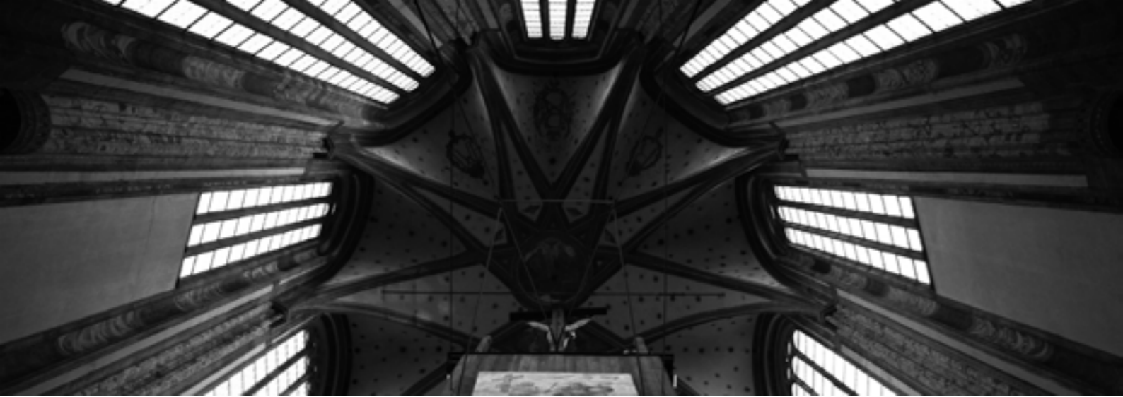
Kostel Panny Marie Sněžné v Praze Autor: Ondřej Šindlář

Podrobnější rozvinutí by si žádal argument, podle něhož má sloveso vigere význam „platně existovat“. Spojení tohoto slovesa s podstatným jménem studia je velmi časté a popisuje – dle kontextu – školu vynikající, prosperující, vzkvétající, nebo také platně existující a trvající. Obrat statuimus, ut vigeat shrnuje v papežské bule všechny tyto významy. Jeho fundační význam je posílen klauzulí perpetuis futuris temporibus , kterou nelze překládat – jak je obvyklé – „po věčné časy“ (pro teologicky vzdělaného člověka má pojem věčnost specifický význam), nýbrž spíše „po všechny budoucí časy“. Míněno je nepřetržitě trvání v budoucnosti, jež se počíná okamžikem příslušné dispozice. Odtud výše navržený překlad „stanovíme, že má od nyníška provždy právoplatně vzkvétat“.