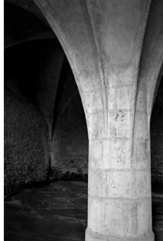
Kaple Božího těla v Kutné Hoře