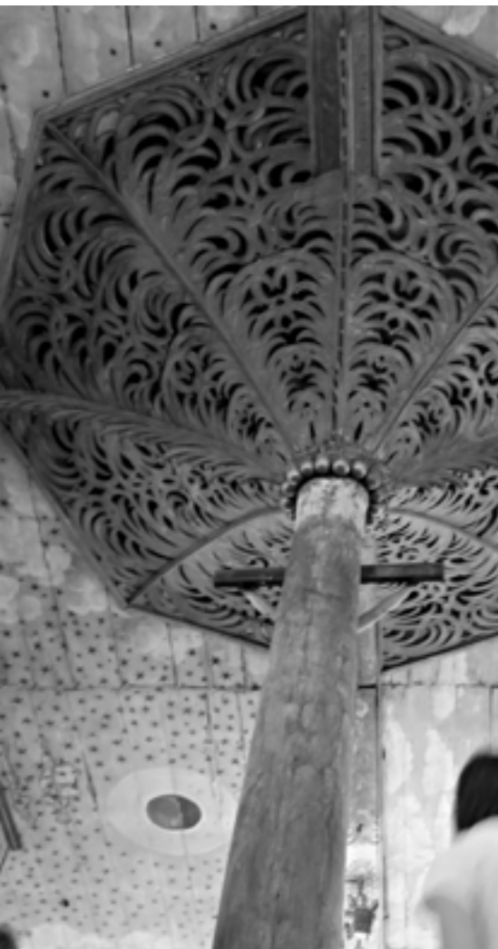
Kostel sv. Jacka v Pogorzelskach Autor: Ondřej Šindlář

U žen byla statečnost navíc často spojena s ctností čistoty. Vyprávění o nich se inspirovala helénským milostným románem, v němž dvojice milenců prožívá nucené odloučení, prochází různými nástrahami a obtížemi, aby se nakonec znovu šťastně shledala. V křesťanských textech nejde ale o lásku tělesnou, nýbrž výhradně duchovní. Pašije o sv. Anežce Římské z konce 4. století vypráví příběh krásné třináctileté dívky, do které se zamiluje syn římského prefekta. Anežka ho však odmítá i s nabízenými dary s vysvětlením, že už má jiného milého, kterým je Kristus. Pohanský prefekt ji proto za trest vystaví nahou k potupě v nevěstinci, dívka si však zázrakem zachrání panenství, takže má být upálena jako čarodějnice. Ani oheň se jí ale nedotkne, a tak jí nakonec useknou hlavu. Příběh osudové lásky tak končí – stejně jako v řeckém románu – po mnoha útrapách šťastným shledáním panny se snoubencem, zde mučednice s Ježíšem, ovšem nikoli na zemi, ale až na věčnosti.