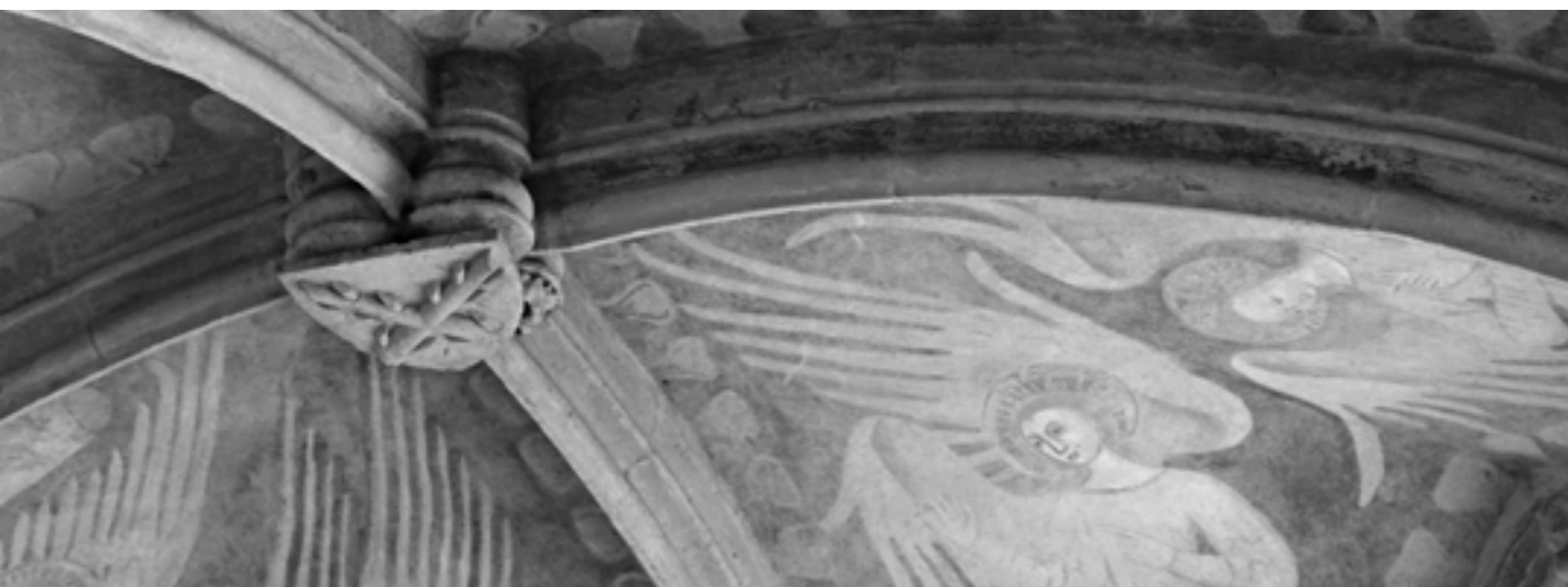
Kapitulní síň Sázavského kláštera Autor: Ondřej Šindlář

Náš spolek není moc známý. Poradců pečujících o pozůstalé existuje více, ale my jsme unikátní v tom, že rodičům, kteří dítě ztratili, pomáháme zaopatřit pozůstatky dítěte. Často se na nás s žádostí o pohřbení obrátí i samotné porodnice, pokud je tělíčko dítěte rodiči definitivně opuštěno. Museli jsme však čelit velkému tlaku médií, která nás obviňovala z toho, že si na tom chceme jednoduše vydělat, zatímco pochovávání potracených plodů nepřipisovala žádnou hodnotu. Historicky se i církev k nepokřtěným zemřelým dětem chovala s odstupem. V současnosti nás však ČBK podporuje, zvláště poté, co na základě naší intervence z roku 2016 vydala liturgická komise Modlitby za mrtvě narozené děti . Tím dala jasný signál k tomu, že je potřeba této problematice čelit i ze strany duchovních. Je zajímavé, že už v rámci středověkého církevního práva se v případě smrti těhotné ženy přiznávalo právo na církevní pohřeb i jejímu nenarozenému dítěti.