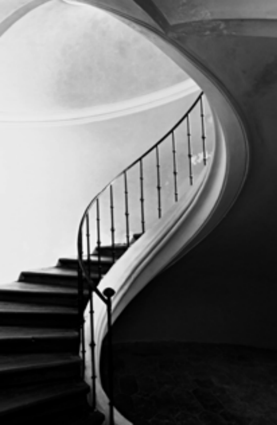
Kostel Nanebevzetí P. Marie a sv. Jana Křtitele v Sedlci Autor: Ondřej Šindlár

Je i na nás, abychom výzvu k parrésii vzali vážně jak ve vztahu ke světu, tak k vlastní církvi.