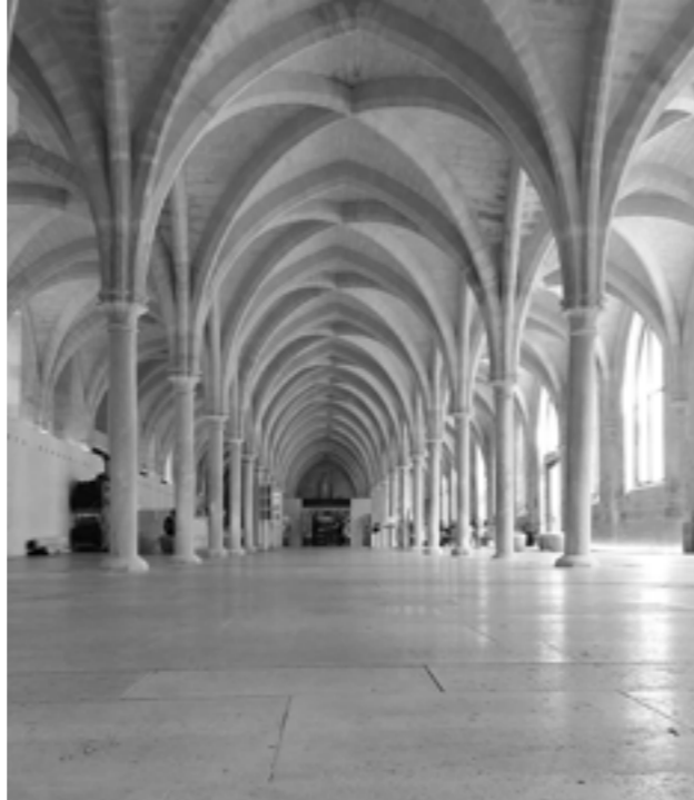
Collège des Bernardins

práce je společná četba textů. První společné setkání s vybraným textem je na začátku týdne při práci v podskupině (samozřejmě si každý student text přečetl už doma!). Společnou četbu asi osmi studentů moderuje jeden z nich. I když dvě vyučovací hodiny poskytují dost času, musí se moderátor snažit usměrňovat každé živou diskusi. Podskupinu doprovází jeden či dva vyučující, s nimiž student moderátor svou porci textu předem konzultuje. Ve čtvrtek se sejdou všechny čtyři podskupiny a jeden ze studentů, jiný než moderátoři v podskupinách, má k danému textu připravený asi 35–40 minutový referát. Po skončení referátu pokládají ostatní studenti otázky, které se zaznamenají na tabuli. Následuje invaze k nápojovým automatům... Po zaslužené pauze student referent odpovídá na otázky. Do diskuse vstupují také všichni přítomní vyučující. Po dvou celých hodinách od začátku se studenti odeberou za svými dalšími zájmy, zatímco vyučující se ještě radí, aby zhodnotili kvalitu referátu i odpovědi na otázky a navrhli známku. Ta se ovšem definitivně stanoví až na konci semestru s ohledem na všechny výkony. Na začátek následující podskupiny jeden za studentů připraví písemné shrnutí proběhlé debaty. A na začátku dalšího velkého setkání se jeden z vyučujících vrátí k referátu z minulého týdne a v krátkém vstupu vypíchne nejdůležitější naukové obsahy. Seminář je náročný jak pro studenty, tak pro vyučující.