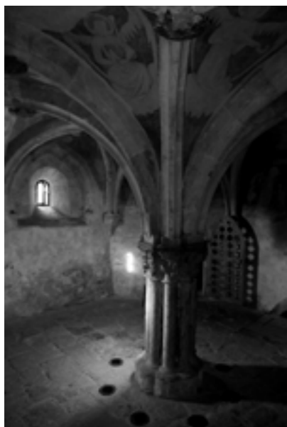
Krypta kostela sv. Štěpána v Kouřimi Autor: Ondřej Šindlář

Nedokázal to však zcela ani Aristotelés, a raději hovořil pouze o ctnostech. My ale máme určitou výhodu. Jsme sice pouhými trpaslíky, ale přesto se můžeme poučit od obrů, na jejichž ramenou stojíme.