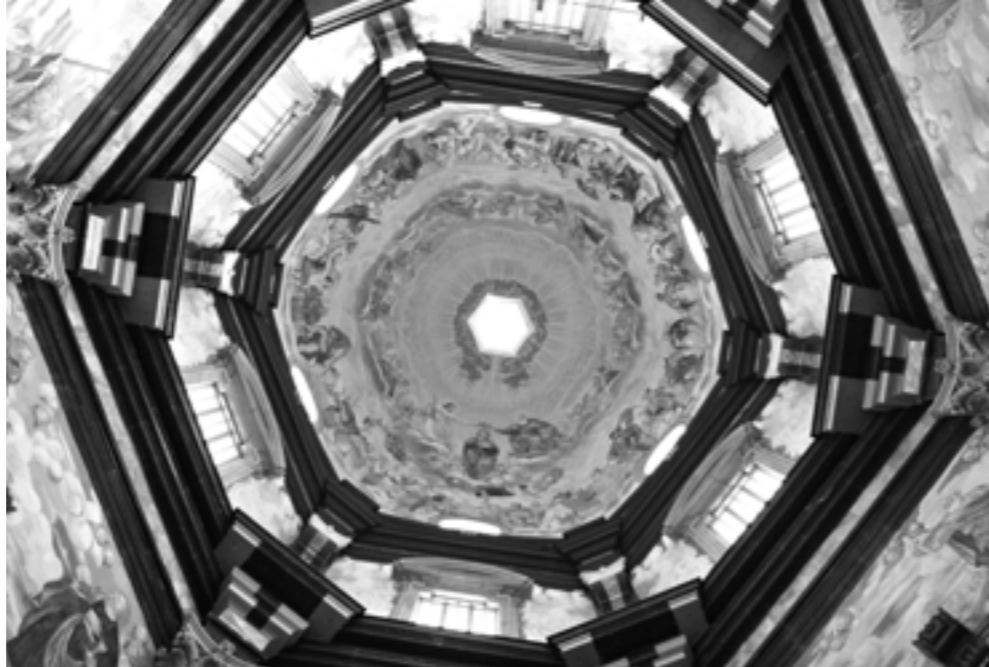
Klášteřínský kostel Pažaislis v Kaunasu

21.–24. 3. konference „Sakramente im Kontext“