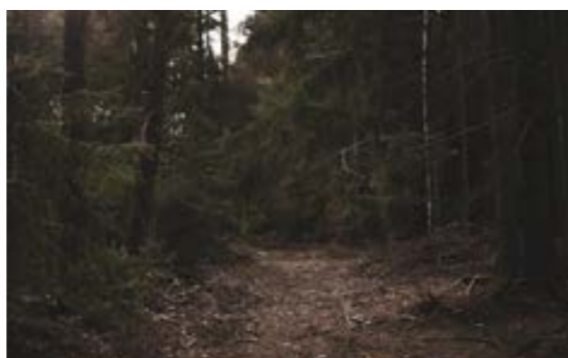
Studentské básně jsou doplněny fotografiemi Kláry Krásenské