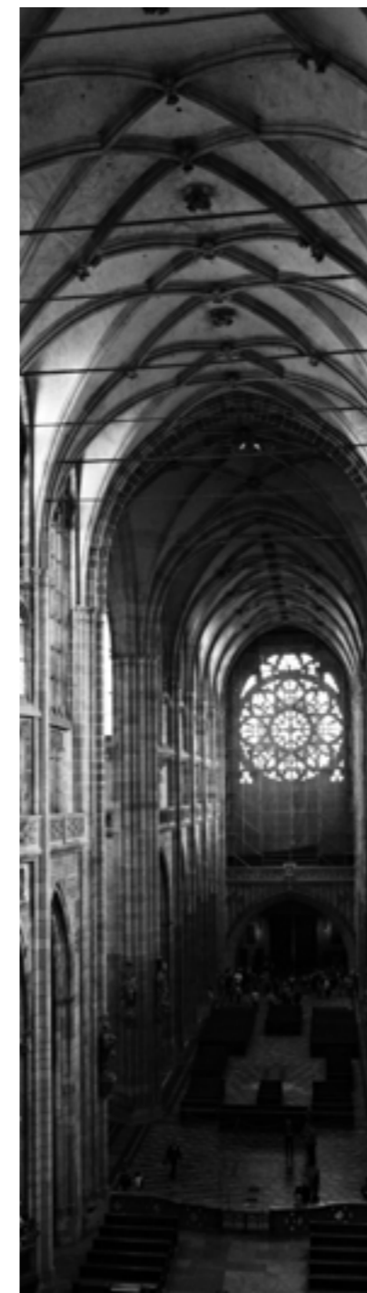
Katedrála sv. Víta v Praze Autor: Ondřej Šindlár

D: Dejme tomu v taktice se zušlechťují rozumové schopnosti. Máš snad dojem, že rozum by se měl zušlechťovat i při „výuce“ statečnosti?