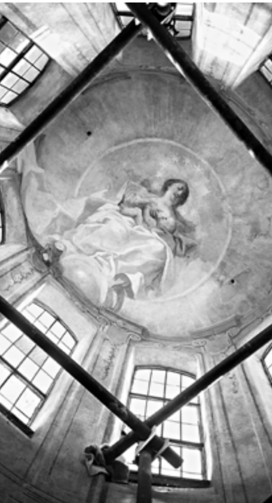
Kostel Panny Marie Vítězné na Bílé Hoře

Dodejme, že pozornosti by neměla uniknout ani „akreditační“ formulace listu, jímž Karel oslovil řádové kapituly, aby vyslaly do Prahy studenty teologie, kteří by se tu posléze stali magistry, aby tak univerzita dosahovala kvalit učení pařížského a oxfordského. S užitím majestátního plurálu Karel psal o „naší univerzitě“ a o „našem pražském učení“, jež je dobrotivostí Apoštolského stolce privilegováno do té míry ( adeo apostolice benignitatis grato presidio privilegiatum existat ), že se tam může konat všechno to, co je dovoleno ostatním obecným učením. Dopis, obsažený ve sbírce Collectarius perpetuarum formarum , není datován. Snad vznikl záhy po r. 1355 – Karel se označuje za císaře a současně hovoří o univerzitě jako „nové sadbě“. Obsahově text koresponduje s tím, co uvedl ve své kronice níže zmíněný František Pražský.